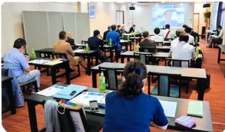
越後春日山RCの皆さん お隣同志です お互いに 地域の為に頑張りましょう！