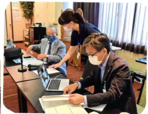
会場内緊張気味の皆さん