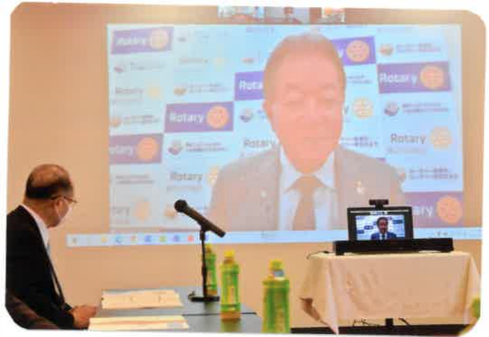
貴重な講話ご指導 1時間あっという間に経過 少し時間延長し 皆さん熱心に聴講致しました