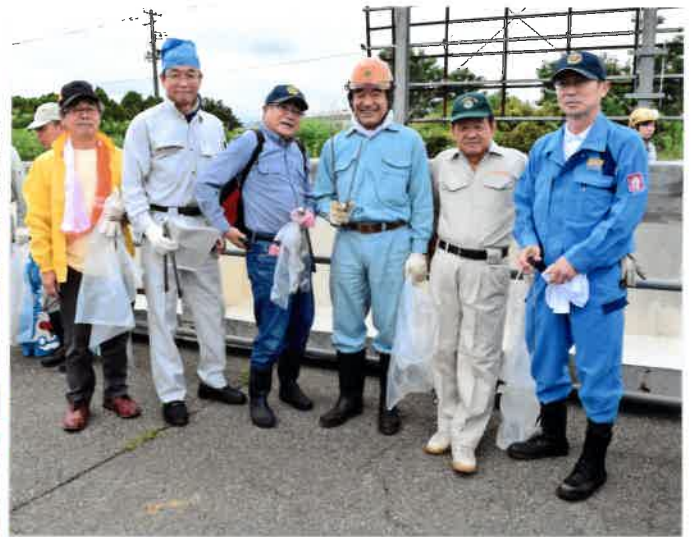
フル装備 張り切るRCの皆さん！