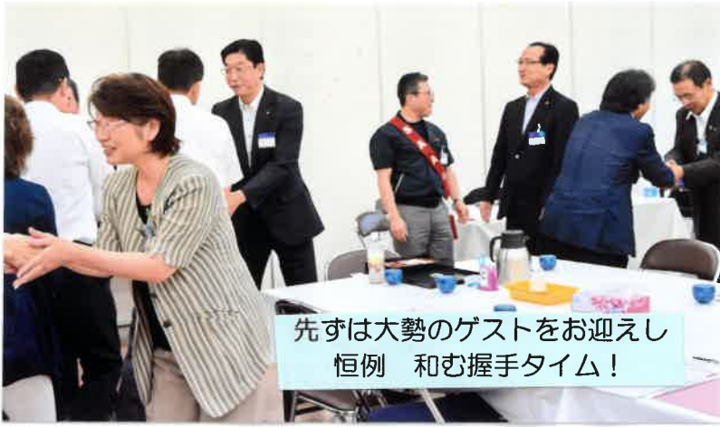
先ずは大勢のゲストをお迎えし 恒例 和む握手タイム!