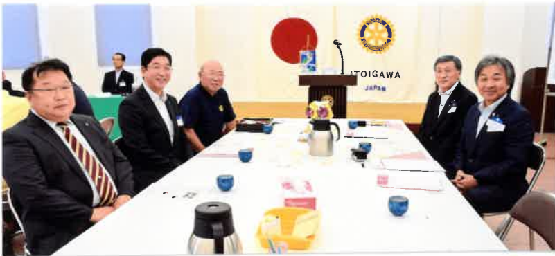
本日のお客様をお迎えして