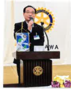
本日の例会大勢のゲスト皆様をお迎えして