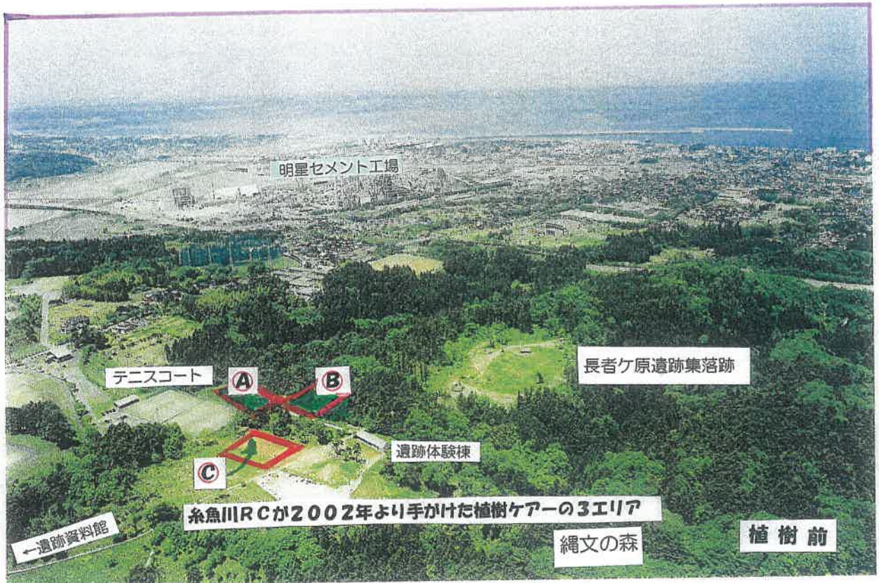
長者ケ原遺跡公園 (南東上空から遺跡公園、市街地、姫川河口を望む)