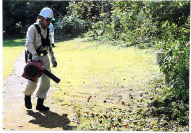
ークラブの皆さん手鎌でアタック 植樹木根回り除草と蔓草除去ー