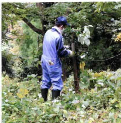
渡邊さん慣れた手つきで蔓草除去