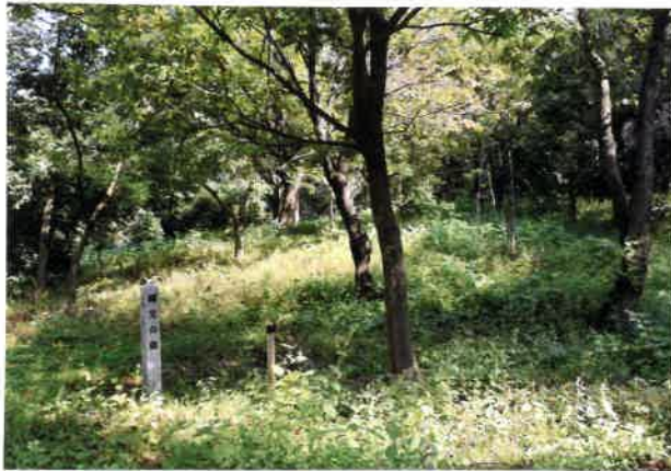
・作業前のBエリア