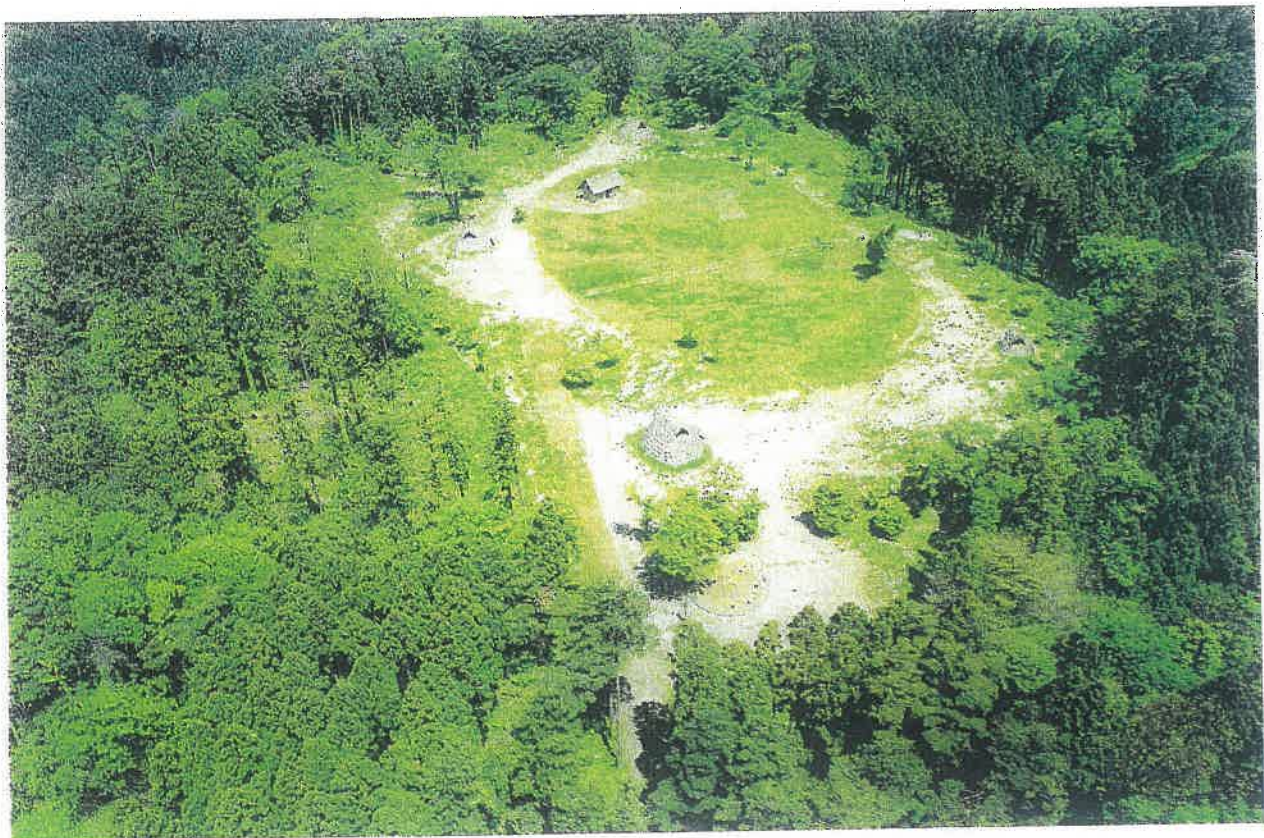
復元された長者ケ原遺跡／集落跡 (集落跡の南上空より)