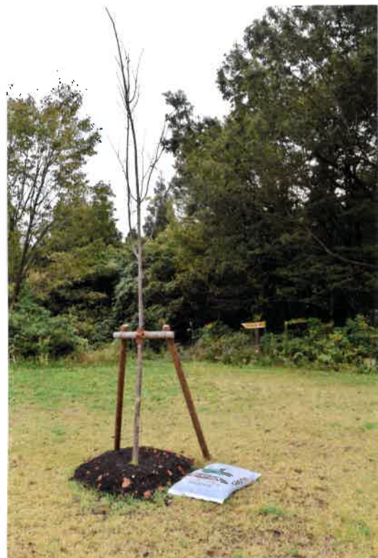
◎ 苗木根元部に腐葉土を盛る作業に