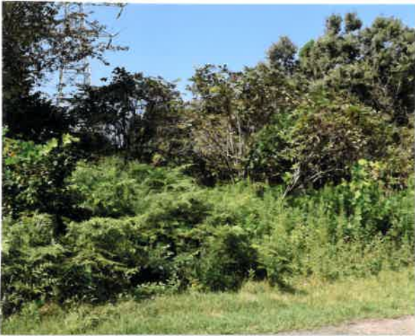
・草刈り作業前 Cエリア