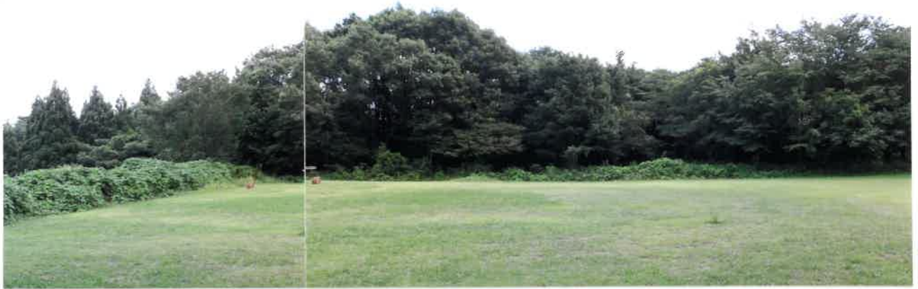
植樹前の公園広場（南端部）