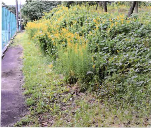
・草刈り作業前 Aエリア