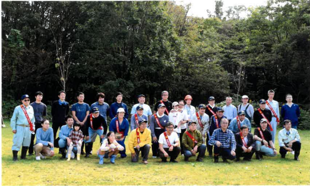
糸魚川 RC 財団地区補助金事業 縄文の森植樹 2021/10/16