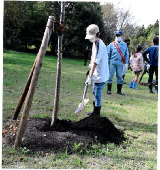
・小学生お子さんも作業に参加