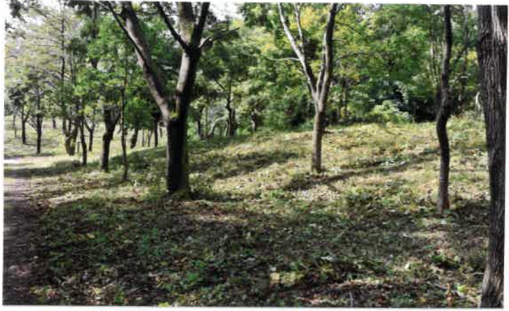
・作業終了 Bエリア