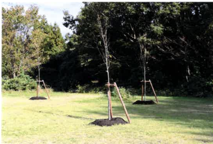
植樹作業全工程終了 3年後5年後 緑一色から 見事な桜花の彩りが楽しみ！