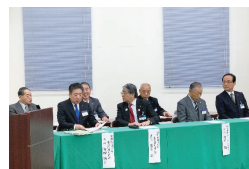
復興地域づくり基金 活用委員会