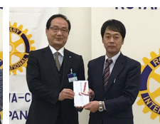
翡翠を新潟県の石にする会