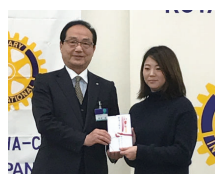
いといがわ復興 マルシェ実行委員会