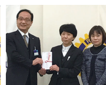
根知谷にきらめく キャンドルロード実行委員会