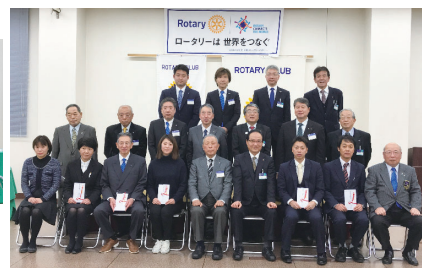
皆さんで集合写真

◆12/21 (土) 第1回派遣学生オリエンテーション及びクリスマス会がホテルハイマートにて開催されました。