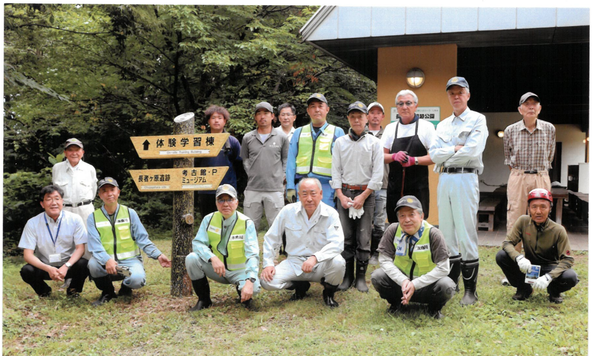
赤星会長年秋季縄文の森草刈り作業 R8.6.25