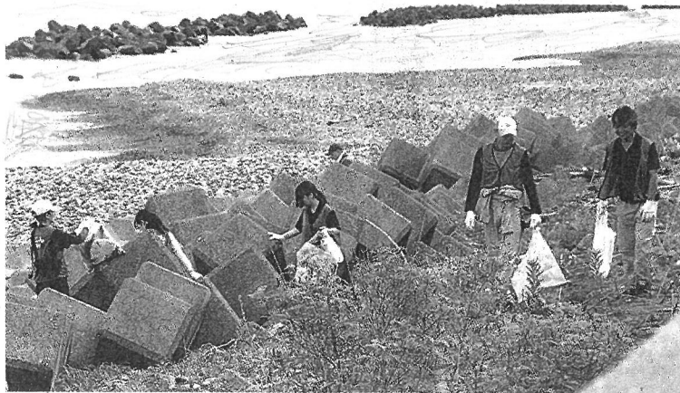
「いとしん」職員と地域の団体、事業所が参加して海岸清掃に取り組んだ（6日、糸魚川市浦本地区）

を守って海を楽しんでもらいたい」と話し、参加者もきれいな海を願って回収や仕分け作業に汗を流した。