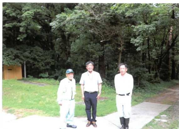
作業着手前 体験棟前で 熊出没の話や 本日の作業手順等話を