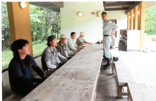
赤星会長挨拶/ 倉又社会奉仕委員長 挨拶作業手順説明及び安全作業のすすめ