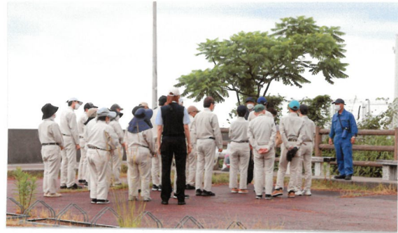
作業協力会社:カネヨ福祉社(株) 作業開始前 人員確認&TBM